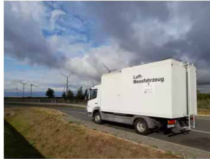
Luft, Klima, Lärm