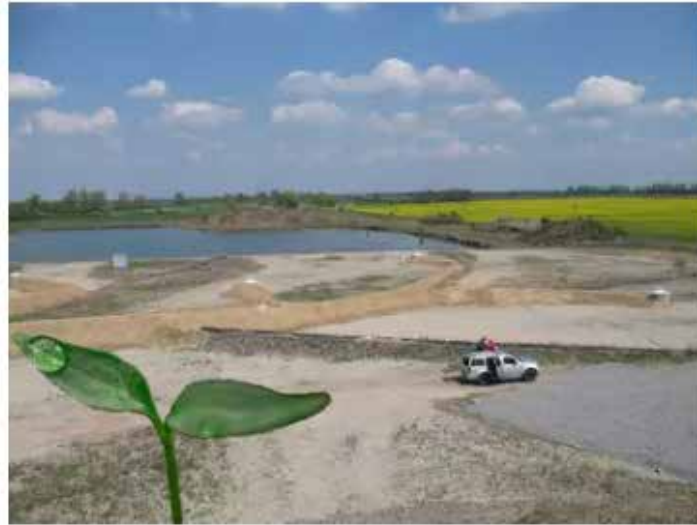
Boden, Wasser, Abfall